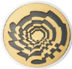
Création de : Antoine La Mendola

Son engagement social et politique n'a jamais cessé de croître et de